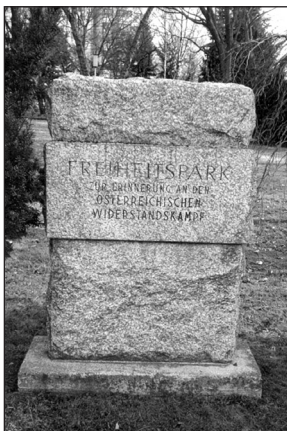
Gedenkstein im Freiheitspark, Wiener Neustadt

Heinrich Sauer (10. 4. 1892 – 2. 1. 1945); biografische Angaben siehe Wiener Neustadt, Bahnhofplatz 1 (Bahnhof), Gedenktafel.