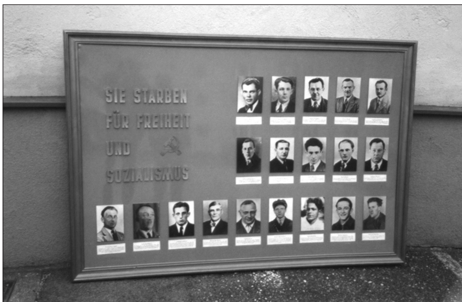
Wiener Neustadt, Kollonitschgasse 12/Stiege 1: Gedenktafel mit Fotos der Opfer