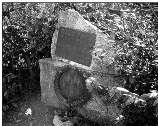
Gedenkstein Pottendorfer Straße/Stadionstraße

Im Gedenken Die Belegschaft des Rax-Werkes